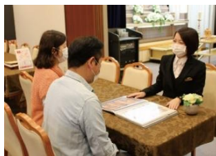
過去に開催した相談会の様子

相談会では、お葬式の準備や段取り、費用、コロナ禍での対応など、不安なことを気軽にご相談いただけます。