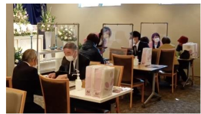
過去に開催した相談会の様子

※新型コロナウイルス感染拡大防止のため、内容変更または中止となる場合がございます。