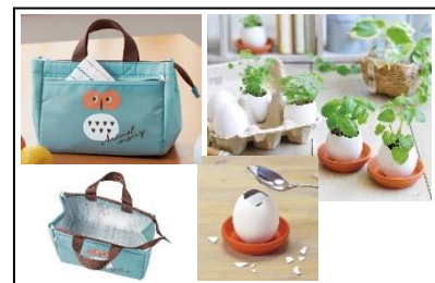
来場者特典イメージ