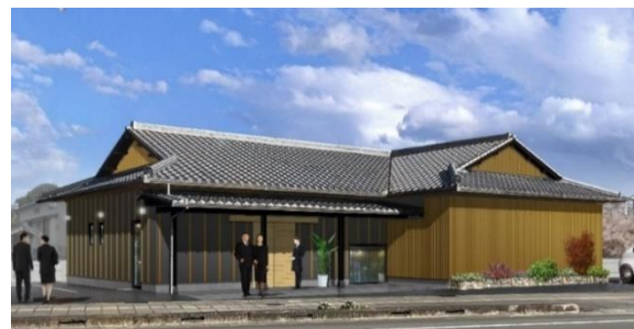
外観イメージ。当社では珍しい瓦屋根に、オリーブ色の木格子を外壁に配した和モダンな造りが特徴。