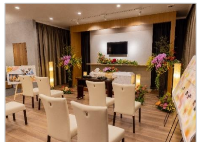
奈良1号店「ファミユ奈良押熊ホール」。オープニングイベントには大勢の方が集いました

※「いすヨガ体験教室」は好評につき11月27日（日）にイマージュホール京田辺でアンコール開催します。