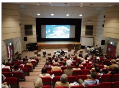
終活映画の上映会や大抽選会で盛り上がりを見せた今年の「いのちのリレーまつり」

2013（平成25）年からは精華町「いのちのリレーまつり」に協賛として参画。今年で7回目を迎えた「今を大切に生きる」「命の大切さ」を考えるこの終活イベントには、約160名の地域の方々にご参加されました。その他「いすヨガ体験教室」※や「想い出供養祭」などの地域イベントを数々開催する一方、接触を控える時勢も踏まえてInstagramやLINEなどを駆使した情報発信も積極化。オフライン・オンラインの両面で、地域に元気と潤いをお届けしています。