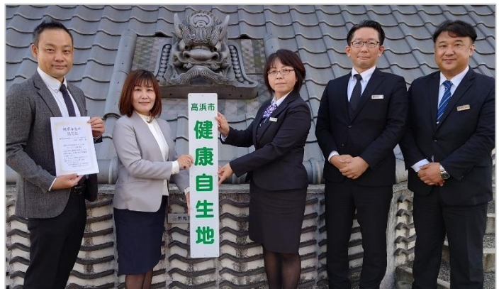
三州瓦を使用した美しい外観の高浜市役所前で （2022年11月18日撮影）

生涯現役のまちづくりが目指す姿 （「たかま元気 de ねっと」ホームページより）