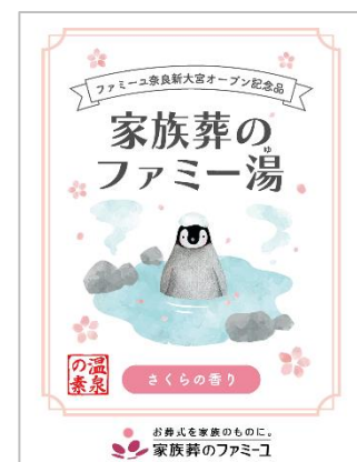
さくらの香りの“家族葬のファミリー湯（1）”

【開催日時】 2023 年 3 月 4 日（土）～3 月 9 日（木） 各日 10:00～16:00（予約不要）