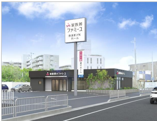
京都と奈良を結ぶ大動脈・国道 24 号線に面した立地