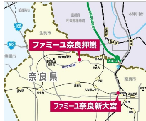
奈良市内 2 店舗の展開で、高まる家族葬のニーズに対応

これまで、けいはんな地域を中心に 8 つの葬祭ホールを展開してきた「花駒」が、ファミリーブランドの家族葬専用ホールを新大宮エリアに出店します。奈良市内は、2021 年 6 月に開業した「家族葬のファミリー 奈良押熊ホール」に続き 2 店舗目。近鉄奈良線「新大宮駅」から徒歩圏内で、国道 24 号線に面した利便性の高い立地です。心を落ち着かせるモノトーンで統一したシンプルな外観の「1 日 1 組・貸切」の家族葬専用ホールで、大切な方との最後の時間を、ご家族や親しい方とゆっくりとお過ごしいただけます。