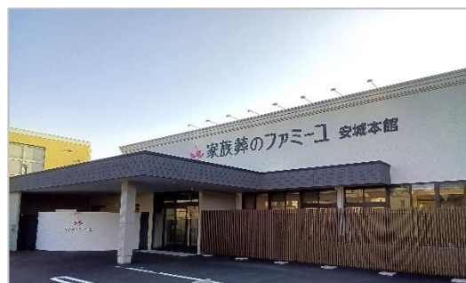
2024年2月22日にオープン「ファミリー 安城本館」 家族葬ホールに相談ラウンジとショールームが併設

・家族葬のファミリー ホームページ： https://www.famille-kazokusou.com/