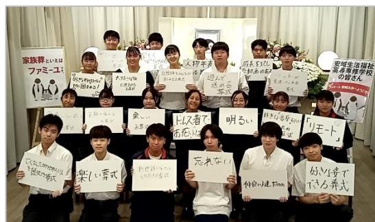
プログラムの終わりに「わたしの理想のお葬式」を提言 (2023年9月27日に参加した3年5組のみなさん)

・安城生活福祉高等専修学校 ホームページ： https://anjo-sf.sakura-g.ac.jp/