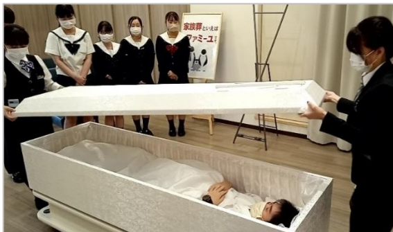
「最初は怖いと思ったが、意外と居心地が良く、 “生きている”ことを実感できた」 (9月参加の生徒の声)