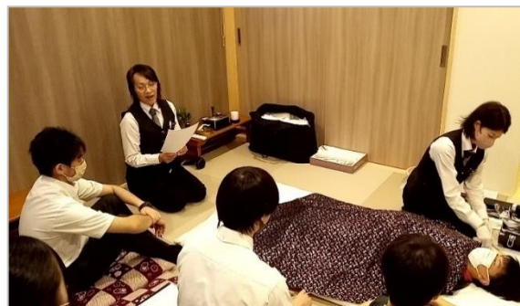
「納棺師さんのすべての動きから、 故人様への温かい想いと優しさを感じた」 (10月参加の生徒の声)