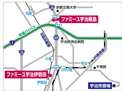
宇治市内は2店舗での展開となる

京都で創業し、けいはんな地域を中心に半世紀以上にわたり葬送を執り行ってきた花駒の同社直営店10店舗目となる新ホール「家族葬のファミリーユ 宇治伊勢田ホール」は、宇治市内を南北に走る近鉄京都線の沿線で、京都府内でも有数の住宅街・伊勢田エリアに位置します。2020年4月に開業した「ファミリーユ 宇治槇島ホール」も同じ沿道（当ホールより北に約3km）にあり、今後もますます高まる家族葬ニーズに対応してまいります。