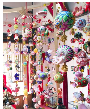
柳川さげもんのイメージ

さげもんは、女の子のお守りとして、親から子、子から孫へ受け継がれ、無病息災を願うもの。猛威を振るう新型コロナが平癒していますように、と半年後の雛祭りに想いをはせながら楽しめるワークショップです。