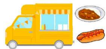
ファミーユの子ども食堂で無料提供（イメージ）