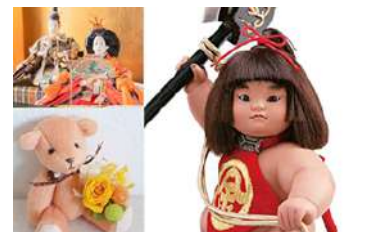
人形供養祭で寄せられる人形の数々（イメージ）