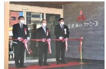
セレモニー（一昨年8/29とろくホール開店時）

楽しいダンスの発表会を開催。受講生のみなさんが日頃のレッスンの成果をお見せします。