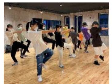
ハンキードリースタジオの受講生のみなさん