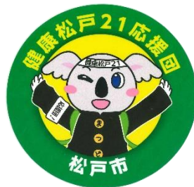
健康松戸 21 マスコットキャラクター「けあら」