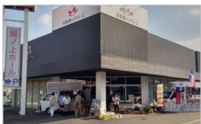
家族葬のファミリー尾ノ上ホール

家族葬のファミリー尾ノ上ホールを会場として2か月ごとに開催し、毎回200人以上が参加します。ホール内ではeスポーツ体験やプラモデル教室、外では多数のキッチンカーや採れたての野菜市コーナーなど、熱気にあふれるにぎやかなイベントです。過去には保護猫譲渡会や防災を学ぶイベントも開催しました。