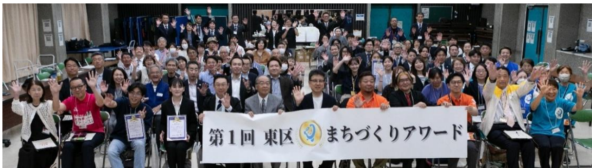
27活動から上位5位に入賞した参画メンバーと大西一史熊本市長（中央）

株式会社きずなホールディングスグループの中核事業会社である株式会社家族葬のファミリーユは、2026年5月25日（月）に熊本県熊本市東区の地域課題解決事業「地域力パワーアップ大作戦 第1回東区まちづくりアワード」において、「グラン・ド・エン賞（最優秀賞）」を受賞しました。