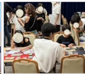
子どもたちに大人気の カードゲームコーナー