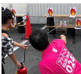
親子で学ぶ防災イベント